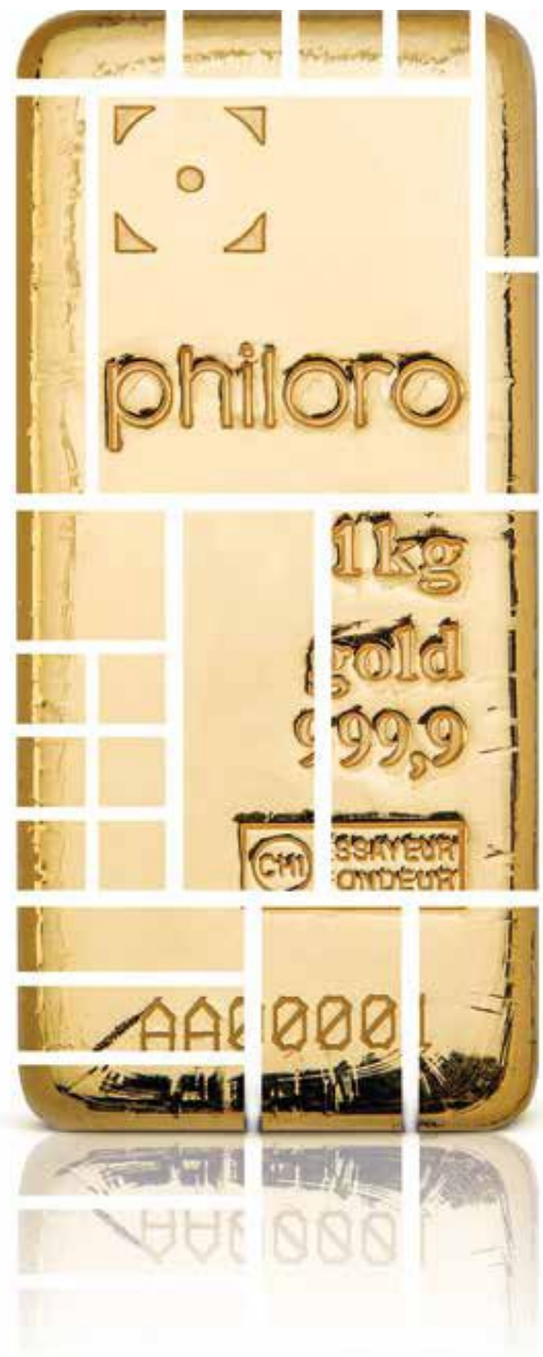
Am Kilo-Barren können von Anlegern auch Stückelungen erworben werden

Die monatliche Sparrate kann dabei flexibel an die individuelle Le-